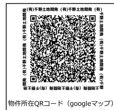
物件所在QRコード (googleマップ)

※各寸法は公図より作成しており、実測後に寸法・面積の増減がある場合があります。 また、官庁指示により造成内容等変更になる場合があります。